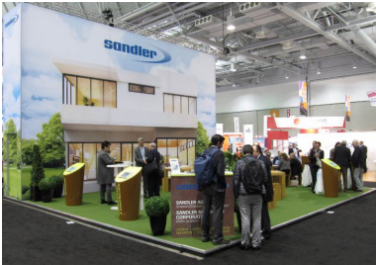
Sandler Garden & Mansion auf der IDEA Show 2016

Auf der IDEA Show lud das Sandler Team die Gäste in einen gemütlichen Garten vor der stylischen „Sandler Mansion“ ein. Die Sandler Mitarbeiter aus Verkauf und Produktentwicklung begrüßten die zahlreichen Besucher zu interessanten und produktiven Gesprächen am Stand, darunter nicht nur Bestandskunden, sondern auch Lieferanten, potenzielle neue Geschäftspartner und andere Messebesucher, die das außergewöhnliche Standdesign schon von weitem angesprochen hatte. Mit dem Messeschwerpunkt traditionell auf Hygieneprodukten und Reinigungstüchern lag der Hauptfokus auch am Sandler Stand auf Vliesstoffen für diese Anwendungen. Doch Sandler stellte auch sein Spektrum an technischen Vliesstoffen vor.